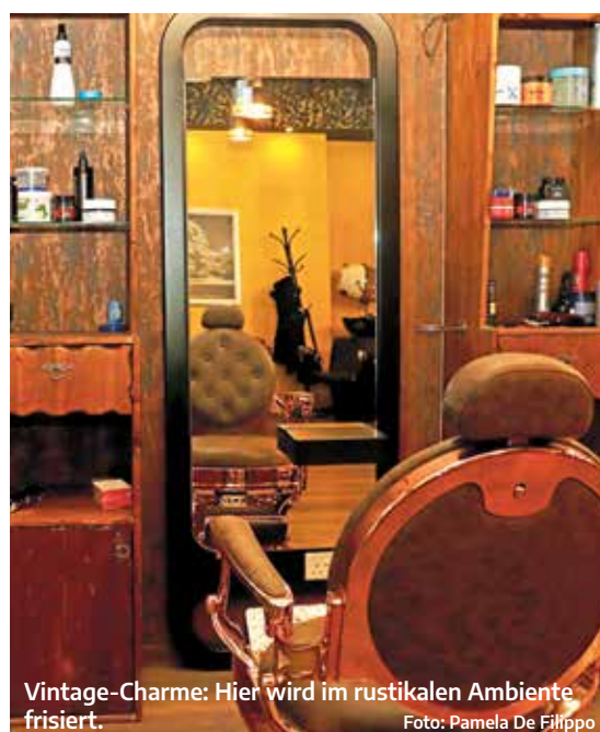
Vintage-Charme: Hier wird im rustikalen Ambiente frisiert.

Bei Gamal´s Barber Club wird im rustikalen Vintage-Ambiente frisiert