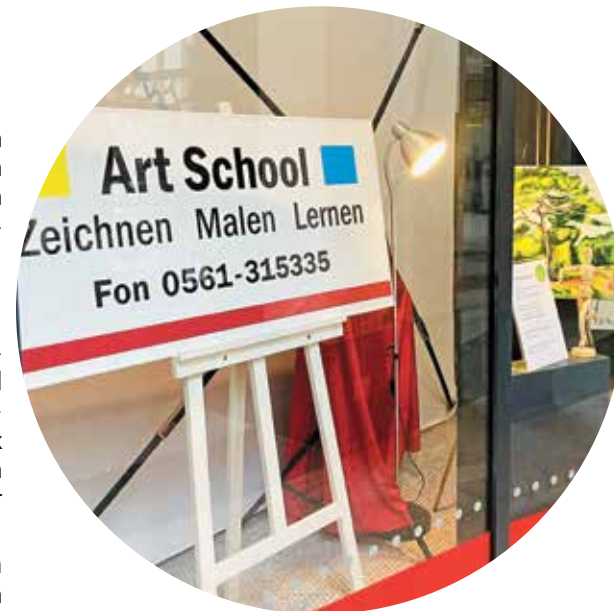
Ein Ort für kreatives Arbeiten: In der Art School kann man im Einzelunterricht zeichnen und malen lernen.